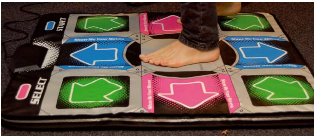
De game Dance Dance Revolution werkt met een echte dansmat