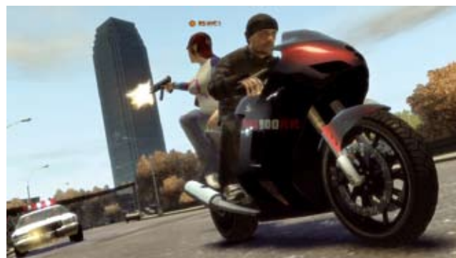
Grand Theft Auto: Controversiële game van uitgever Rockstar Games.

De media staan er vol van: gamen werkt verslavend en zet aan tot geweld. Sla er de krant op na en je merkt dat heel wat gevallen van agressie in verband gebracht worden met gamen. Nochtans komt geweld ook voor in andere media, maar vaak wordt dan aangehaald dat de interactiviteit van het spel de mens veel sterker beïnvloedt. Wetenschappelijk onderzoek naar de effecten van games biedt al iets meer duidelijkheid over het waarheidsgehalte van dergelijke uitspraken. Over de invloed op agressie zijn er ruwweg drie opinies. Sommigen gaan uit van de stimulatietheorie (negatieve invloed op geweld), anderen van de reductietheorie (games zijn een uitlaatklep) en een derde groep ziet geen enkel verband. Uiteindelijk is er nog steeds geen rechtstreeks oorzakelijk verband tussen games en geweld wetenschappelijk bewezen 9 . Verslavend dan misschien? Een goed spel moet in zekere zin verslavend zijn om aan te tonen dat de spelstructuur goed is maar hier wordt verslavend als problematisch geduid. Hierin schuilt wel een reëel gevaar. Gamers kunnen leiden tot fysieke klachten, slaapttekort en verslaving. Het hangt wel samen met het sociale aspect en de groepsdruk eerder dan met de gamefrequentie.